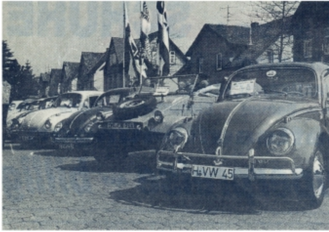
Celler Markt vom 26.04.1990